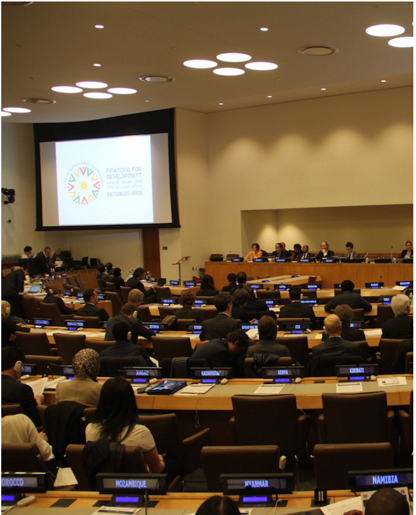
Troisième Conférence internationale sur le financement du développement, Addis-Abeba, 2015